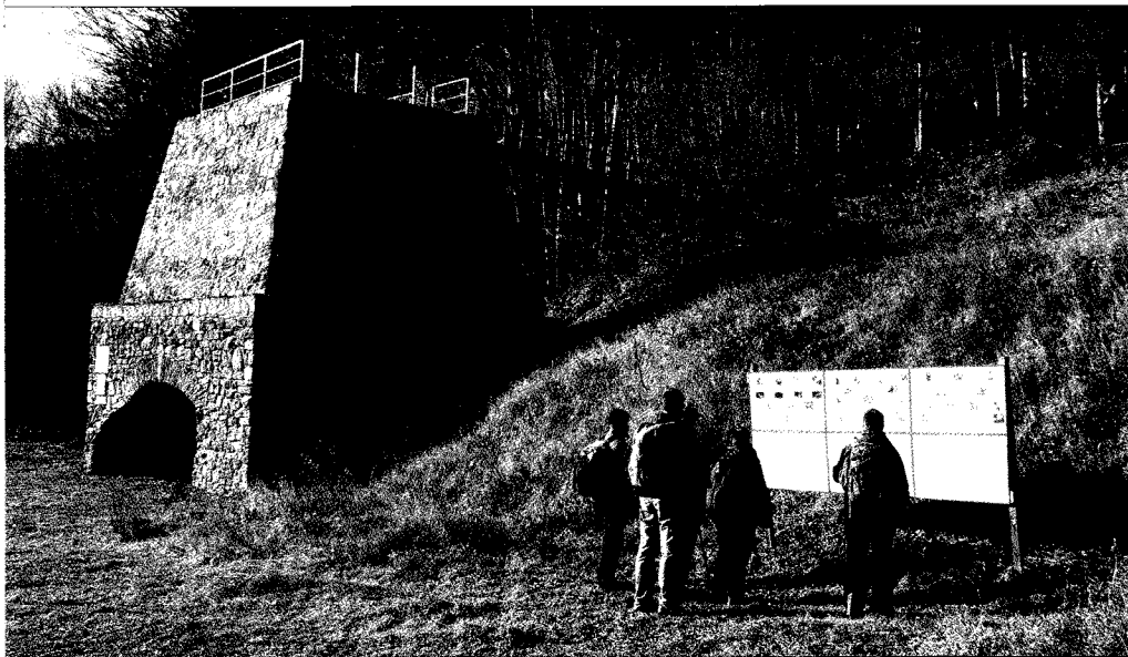
Bodvaji vashámor

Távolság: gyalog 16 km, autóbusszal 43 km, szintkülönbség: + 750 m / – 650 m;